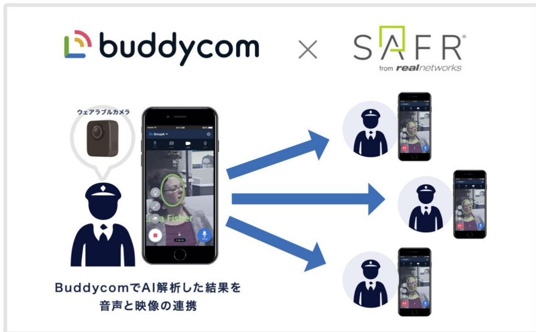
Buddycom と SAFR® の連携イメージ

今後、顔認証だけでなく、モノの認証等、Buddycom のライブキャスト機能に様々な AI を追加する予定です。