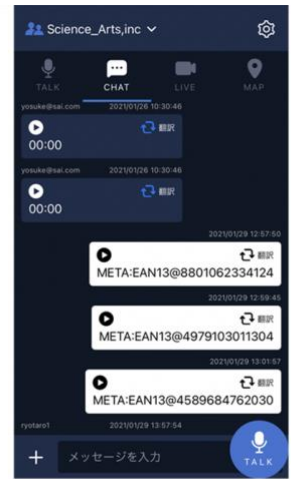
複数のバーコード情報を Chat画面で共有

この技術を利用して、お客様がお探しの商品のバーコードを指定して、iPhone、iPad 搭載のカメラで撮影した複数のバーコードの中から探し出すこともできます。Buddycom 上で一度読み取ったバーコードは、他の音声データ等と同様にテキストでサーバーに保存されますので、過去に保存されたバーコードから探索したい商品を指定する「逆引き探索」も可能になります。